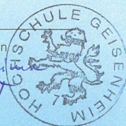
Hochschule / Institution Hochschule Geisenheim Präsident